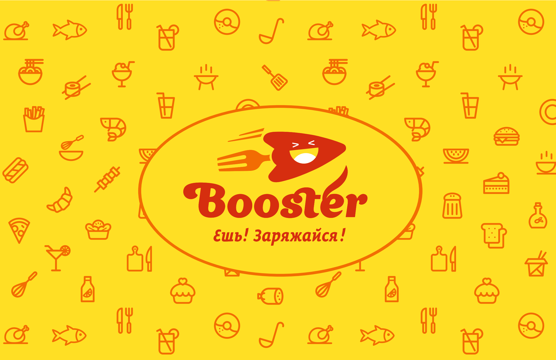
Фирменный паттерн и логотип на его фоне